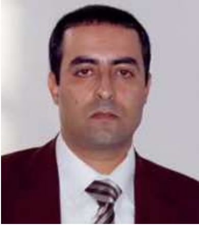
بقلم مدير مجلة الفقه والقانون الدكتور: صلاح الدين دكداك

بسم الله الرحمن الرحيم والصلاة والسلام على أشرف المرسلين وبعد ، يسعد مجلة الفقه والقانون أن نضع بين أيديكم العدد الرابع والخمسين لشهر أبريل 2017 ، وقد زخر العدد الجديد بمجموعة من المواضيع الهامة من بينها ما يلي :